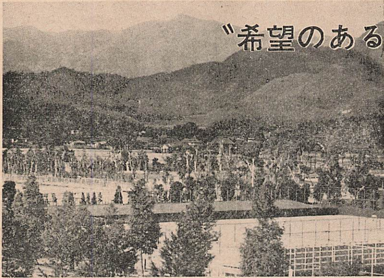
方便山のふもとにひろがる吉敷地区。維新記念公園は、この地区に「緑の空間」を「先取り」した感じである。風致・生活環境の地——として「希望のある地区」だ。