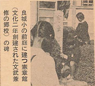
良城小の前庭に建つ憲章館(文化二年創建された文武兼修の郷校)の碑

維新百年公園 42年から着工、現在の県競技場に隣接する『下園地』の最後の仕上げ中。人工池、芝生の自由広場、遊歩道。樹木、花木がたくさん植えられている。下園地は来春開園。48年度から森林地帯の『上園地』の整備にかかる。完成すれば50万平方*の大公園となる。