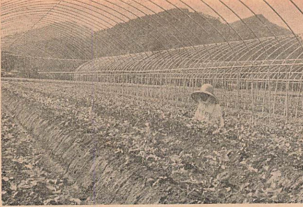
最近は施設園芸が盛んです。とくに、いちご栽培が各地で普及しています(大内地区で)