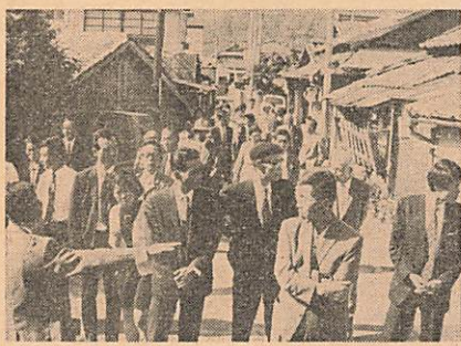
同和教育専門指導員のみなさんが、地区の実態を視察しました

このように差別する人、差別される人で十万都市山口をつくっているのです。このようなことで、市民みんながしあわせに暮らせる本物の、民主・文化都市ということではできません。 市政としても、まず第一に山口市同和問題対策審議会を設置し、市の全機能をあげて、この問題の解決に努力しています。 第二に、同和対策室を置き、総合的の見地から同和事業を中心にすすめています。 第三に同和教育については、教育委員会において計画し、市内の全公民館、全小・中学校およびPTA活動の中で実施しております。 また隣保館、集会所を地区内に設置し、地区活動を援助しております。しかし、もっともたいせつなことは「人」です。まずそのために、行政が市民の先頭になって、この問題の解決に全力をあげて取り組まなければなりません。