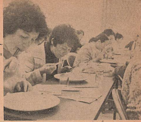
どのお米がおいしいかな... 真剣な口もとです