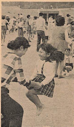
第1回市民スポーツデー開く (10月10日・体育の日)