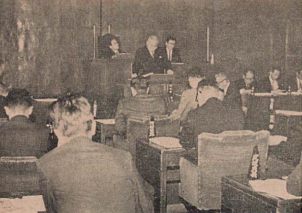
12月市議会で市政の概況、上程議案について説明する兼行市長