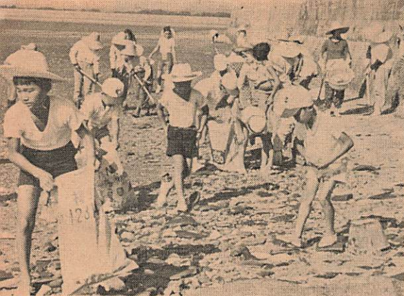
子どもたちの海岸の清掃 (嘉川相原海岸)