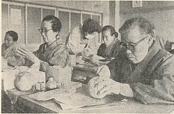
人形づくりを楽しむお年より 福祉センターで

ことしのお正月には、例年になくたこ上げがたくさん見られました。各地区でも子ども会を中心にしたこ上げ大会や、どんどん焼きなどが行なわれました。 また、小鯖小学校では新学期の始まった一月九日の日に竹馬大会を開きました。冬休みに、親子で協力して作った竹馬に乗って楽しいひとときを持ちました(写真右)。 福祉センターでは、お年寄りの人形づくりが始まりました(写真上)。人形づくりはみんな初めてとのことですが、「趣味と実益」を兼ねた月二回の講習会に、みんなはりきっています。こうした「手づくり」のものの中や、忘れられようとしている年中行事の中に、素朴なよるこびがあるものです。