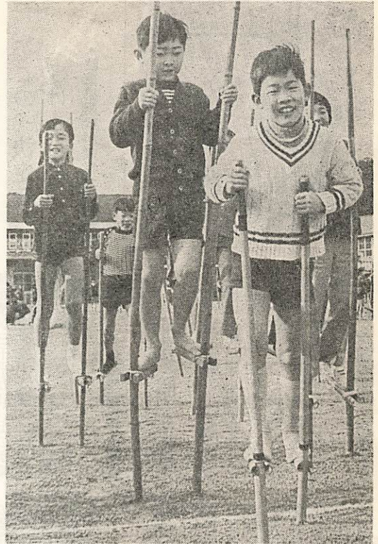
親子で合作の「愛馬」に乗って、イチ、ニ、イチ、ニ