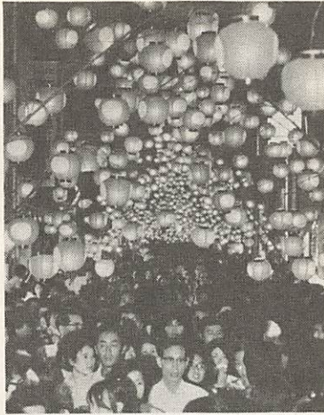
ちょうちん七夕祭り・8月7日夜

台風が山口県より西(朝鮮半島)を通過するときは風台風、東(広島県方面)を通過するときは雨台風といわれます。南部沿岸地方は、高潮に注意しなければなりません。台風と満潮が重なる危険ですし、とくに潮位が高くなる満月と新月その前後は注意してください。