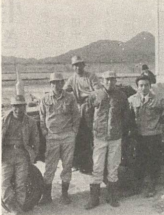
農事組合法人名田島信託組合

からの組合員五人がメンバーで「いつさいの出稼ぎなし」の専業農家。耕起—育苗—田植—刈取り—脱穀—乾燥—出荷まで一貫した請負いと、部分請負い(耕起等)があるが昨年の一貫請負だけで二十五畝。「将来は五十畝(組合員一人十畝)まで拡大したい。そのためにも信頼される組合員にならねば」とい