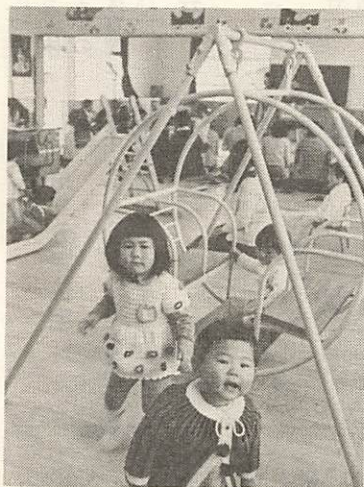
完成した山口第二保育園

建築費四千九百九十四万四千円、収容定員は三十人でゼロ才児から二才児まで各十人を保育します。