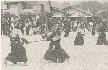
青空の下で少年剣道祭

▼読書感想文・画の募集 五月一日から十四日まで子どもの読書週間です。小・中学生の読書感想文と感想画を募集します。 ▼作品の締めきり五月十五日 ▼入選作品は賞を贈り、展示します。(展示会は五月二十八日から六月二日まで) ▼少年剣道祭 子どもの日を記念して市内の小・中学生の剣道祭を開きます。 ▼とき 五月五日 午前九時 ▼競技 基本動作・かかりげいこ・個人戦・団体戦など ▼申し込み 四月二十日までに児童文化センターへ ▼衛星通信所写生画展 三月に行なった川東・川西地区小学生(五年)の写生画入選五十七点を展示。四月十七日から四月二十四日まで。 ▼文化クラブ作品展 四十九年度文化クラブ(絵