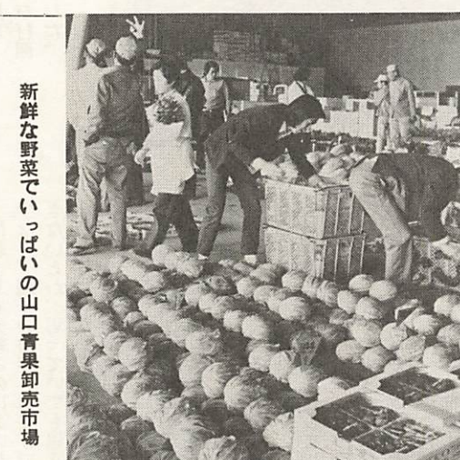
新鮮な野菜でいっぱい山口青果卸売市場

あなた、野菜や鮮魚の市況、料理メモを電話でお知らせしているのを知っておられますか。毎日午前十一時から終日(日曜、祭日を除く)お知らせしています。五―四―一―四を一度回わしてみてください。話中くでしたら一回のテープが二分三十秒です。からしばらくお待ちください。