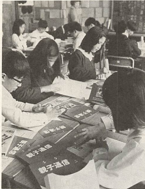
お父さん、お母さんへどんな手紙を書こうかなと 考えながら、ポストを組立てる子どもたち

平川地区は、市内でも急激に変ぼうした地域で、山口大学の統合移転、県営、市営住宅の造成で、静かな農業地域が学術、文化の中心地となり、若者の町として、また、若夫婦の住宅団地がふえています。 職業も多彩化して、共稼ぎ家庭も増加し、親子の対話もとだえがちになり、それを打開するために親子通信ポストをつくりました。