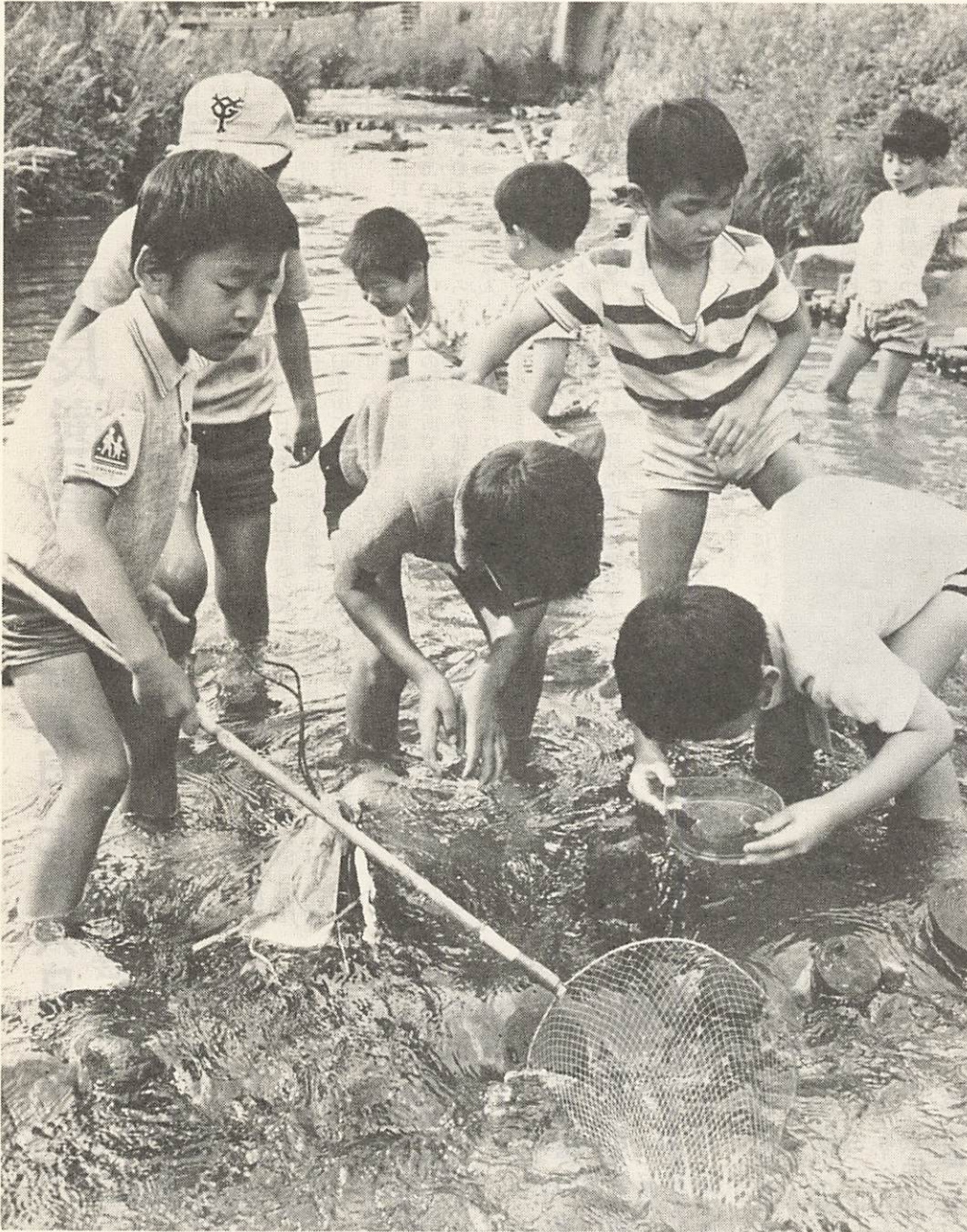
一の坂川で遊ぶ子どもたち