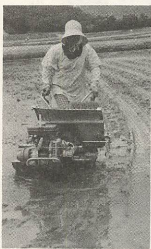
田植えの方法はかわったが良い米を作りたいという気持は同じ

農業・農村は、国民に食糧を供給するたいせつな役割がありますが、さらに国土を保全し、自然環境を守るはたらくもつていて、日本民族発展の基礎づくりもここにあります。 このように農業のもつ役割と使命は重要なものですが、最近ややもすると、農業を軽く見る風潮があることは残念です。 農業者自らが、農業の重要性を確認し、自信と誇りをもって時代に即応する農業・農村をつくり出すことがいまいちばん望まれています。 現在、県下の農業委員会系統組織は、関係機関団体と連けいをとって、『農業をたいせつにする運動』を進めています。これは農業の発展、農業者の地位の向上、自然環境の保全をはかることを目的としています。 時代に即応する農業 『農業をたいせつにする運動』