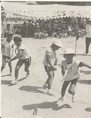
(昨年の小鯖幼稚園の運動会)