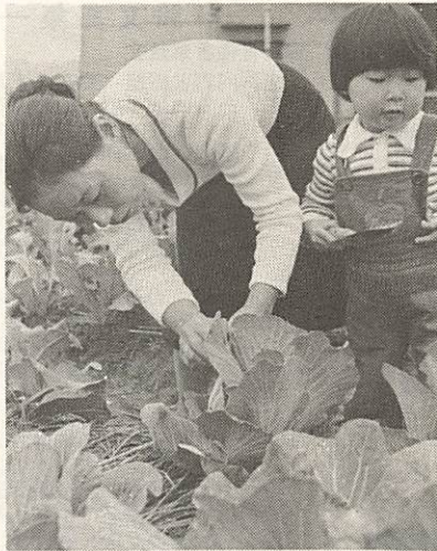
青あおとよくてきたキャベツに虫がついてはたいへん