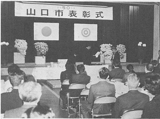
表彰式で堀市長から表彰状と記念品が贈られました。