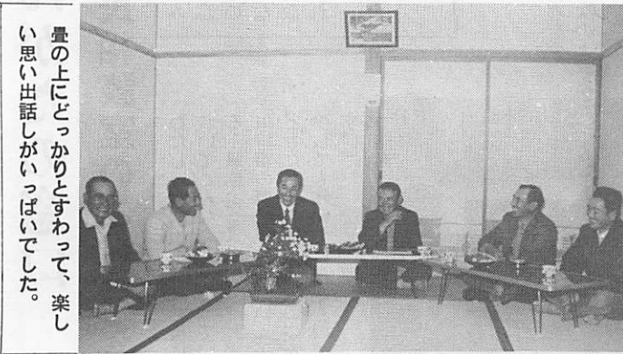
量の上にとっかかりとすわって、楽しい思い出話がいっぱいでした。