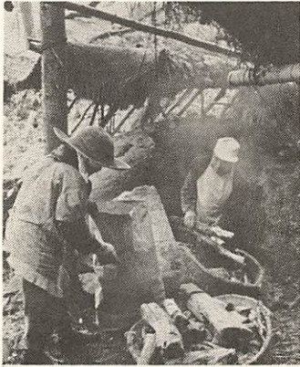
山あいには白い煙がたなびく炭焼き風景も、ほとんど見られなくなりました。

市民相談室の仕様の内容を少し具体的にのべますと、次のようなことです。 ・道路やみぞがこわれたが、こをこうしてほしい(苦情や要望)。 ・家庭内や近所との問題(親子・夫婦、汚水や騒音など)で悩んでいる、個人的な心配ごと。