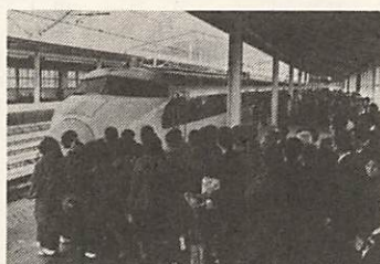
山陽新幹道が開通

■ 4月 特別養護老人ホーム「梅光園」が開園(1日) 四年制に昇格した山口女子大学で初めての入学式(10日) 山口県議会議員選挙 老人憩いの家「嘉泉荘」オープン(23日) 市議会議員選挙(27日)