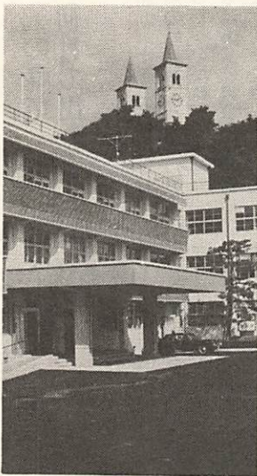
市役所が新庁舎に移転