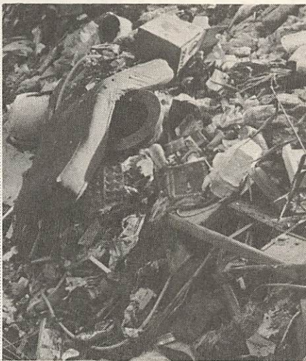
埋立地に燃えるごみがすてられています。区別して出してください。

一度に多量のごみがでたときは、大内の清掃工場へ直接持って行ってください。大内清掃工場の手数料は一般家庭のごみは五十鈴までは無料ですが、五十鈴を超えると基本料金が五十円、それ以上は五十円加算されます。