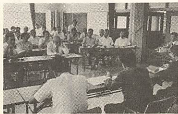
市政懇談会を各地区で開催

■9月▽老人福祉電話第一号を堂の前の山崎さん方に設置(1日)▽市庁舎改築・消防庁舎新築移転の開庁式を市民会館で開催(4日)△市長が出席しての市政懇談会を各地区で開催(9日)▽中国縦貫道建設で発掘の無縁仏約四百体を仁保源久寺にまつり供養をする(20日) ■10月▽国勢調査実施、山口市の人口は十万六千九百九十九