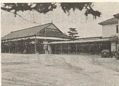
屋内運動場が建設される 大歳小