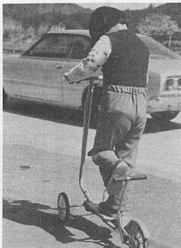
子どもたちに人気のローラースルー道路での遊びはたいへん危険です。

三月二十五日、葵二丁目の国道で小路から出た乗用車と、十六才の人が運転するバイクが出合いがしらに衝突、バイクの老人は左肩を骨折、四ヶ月の重傷を負うという事故がありました。 さいわい老人は、ヘルメットをかぶっておられたので、一命にかかわることはありませんでした。