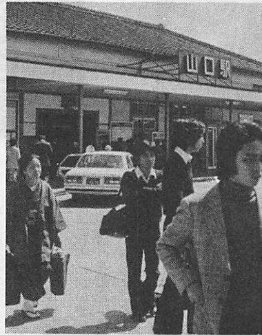
訪れる観光客のために山口駅前に案内所ができます

「史跡と観光のまちづくり」のために史跡の保護保存と観光客誘致とその利便の対策を中心とします。