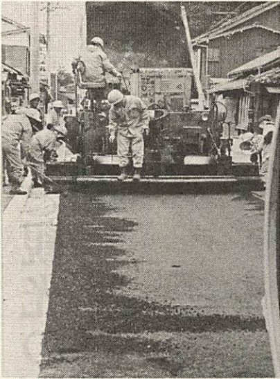
生活道の整備には力を入れます