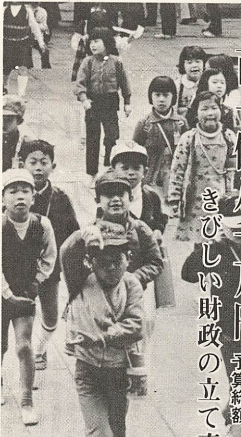
明日をにう元気な子どもたち

山口市の五十一年度の予算が決まりました。山口市の五十一年度の予算が決まりました。