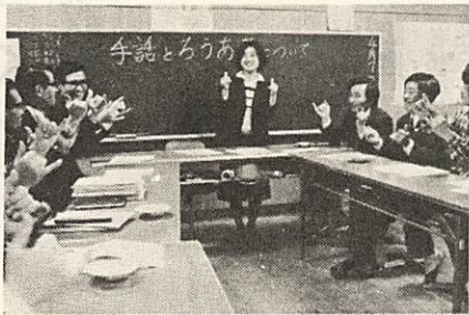
手話の練習に励む友の会の人々

朝倉など三か所の歩道の整備、白石上東線などで見通しをよくする視距改良、原条由良線などで車の通行を安全にする待避所の設置のほかガードレール