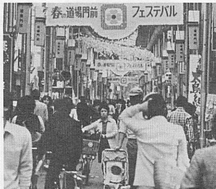
商業調査の対象となる商店街