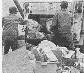
ごみの収集作業 (平川平井住宅)

この手数料の五十一年度の総額は、約七百五十万円です。また、一般家庭でなく、事業活動で排出される産業廃棄物の処理料として車両積載許容量によって、一トまで五百円、一ト四トまで千円、四ト六ト二千円、六ト以上三千円を現場で徴収していますが、その五十一年度の見込額は、二百万円となっています。