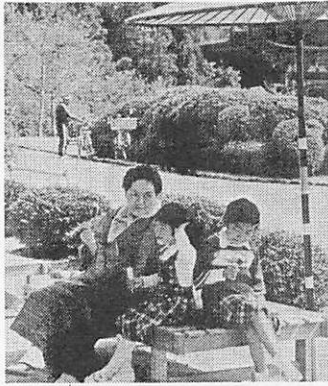
夏も近づき日ざしも強くなってきた。みどりの木々も一せいに天に向けてのびる。みんな外に出よう(香山園で)