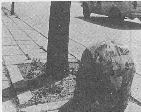
夏にはマツバボタンが可れんな花を咲かせて、道行く人の心をなごませてくれます