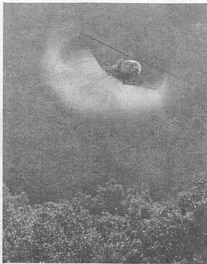
鑄銭司、陶地区を松くい虫防除の最前線として北部侵入をくい止める、ヘリコプターによる空中散布は早朝の風のない時に行われる

鑄銭司地区の山林一帯に、ヘリコプターで昨年に引き続き農薬を散布する計画です。 ▽実施区域と期日 (1)鑄銭司大平山一鷹の子一帯 山林八十二軒 五月三十日と