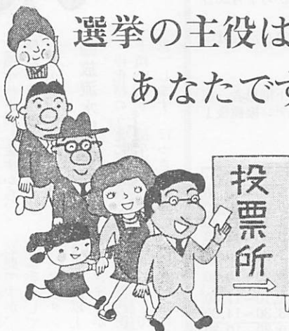
投票所入場券の配布