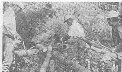
被害にかかった松は、伐採するしかありません。ほっておくと幼虫が成虫となり、健全な松が被害をおこむことになります

南部の被害の多い地区は、松林全体を伐採し、材の利用(チップなど)にしましょう。 薬剤による駆除には、補助金制度があります。くわしいことは、市役所農林水産課か森林組合にご相談ください。