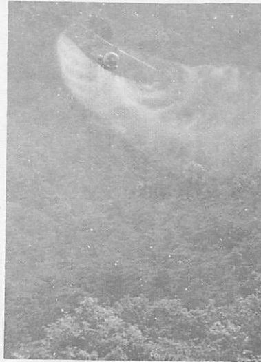
南部を中心におとろえる気配のない松くい虫被害、今年ば空中防除を300ha実施の計画をしています。

まります。今年、意識調査、実態調査の年で、計画を検討します。 また、仁保上郷の農村振興のミニ総合パイロット事業にかかります。