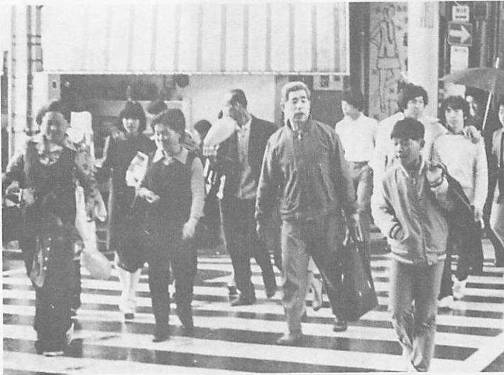
街頭をいそがしくいきかう市民のみなさん、お互いに住みよい山口の実現に力をたずさえていきたいものです。