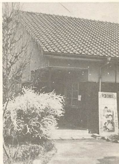
一改築が決まった陶公民館一