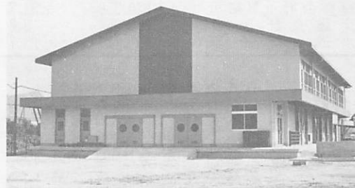
完成した大歳小学校屋内運動場

完成した屋内運動場は、鉄骨造り山型ラーメン型で、建築面積七百二十八平方メートル、総事業費八千三百二十六万円でした。