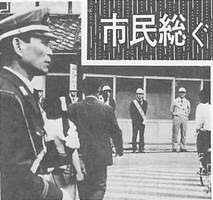
交通安全を呼びかける関係者(早間田交差点)

学校、職場あるいは地域の婦人会、老人クラブなどで交通安全の話し合いをし、交通事故全滅の日まで、市民総ぐるみでたちあがります。