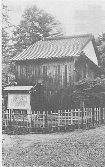
生け垣、案内板など周囲の整備も終わった香山公園内の枕流亭