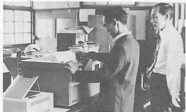
▶(威力を発揮する電送装置 佐山出張所)

遠隔出張所(南部出張所と仁保・小鯖出張所)と本庁市民課を結ぶ高速模写電送装置が、六月一日開通しました。