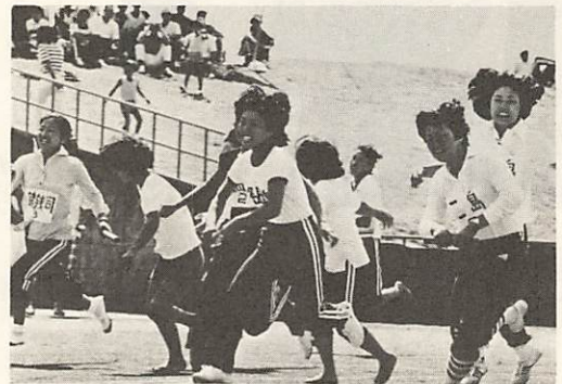
地区の榮譽をになつて走る一走る。Bプロ ック女子の400メートルリレー。