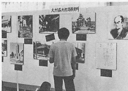
益次郎資料、が展示された市民ホール