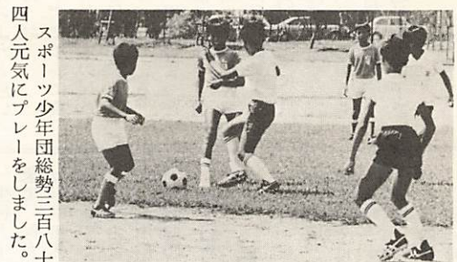
スポーツ少年団総勢三百八十 四人元気にプレーをしました。