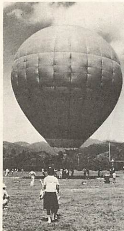
20メートル余の高さの熱 気球が、秋空にフワリと 上っていきました。