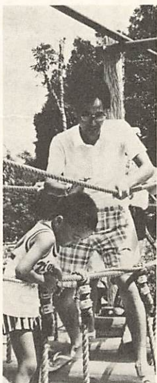
お父さんと競争だ いー市内で初めての フィールドアスレック ク。