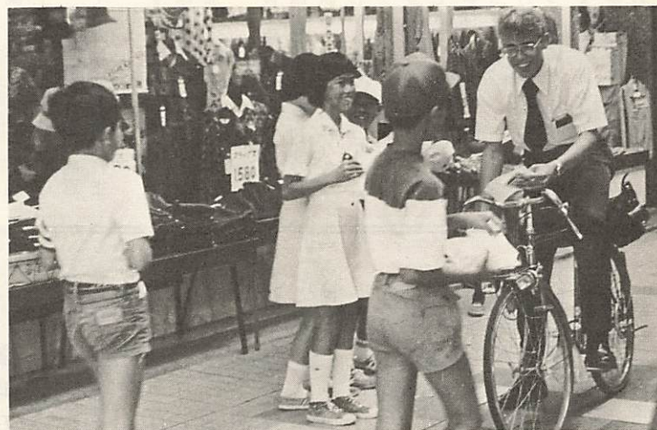
（交通事故をなくそうと道場前商店街で市民に呼びかける交通少年団員）

大殿交通少年団の結団式が、九月二十三日 豎小路の山口市福祉センター広場で行われま した。