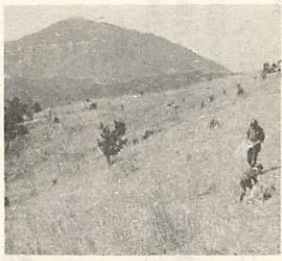
東鳳、翔山からみる西鳳、翔山

昭和五十二年三月三十一日まで使用してました「印鑑登録手帳」(青色)は、四月一日から印鑑登録カード(硬質のプラスチック)にかわり、印鑑登録手帳(青色)は、来年三月末から使用できなくなります。これまでに、印鑑登録をしてる人は、登録した本庁市民課または出張所に、新しい印鑑登録カードが用意してありますので早く交換してください。