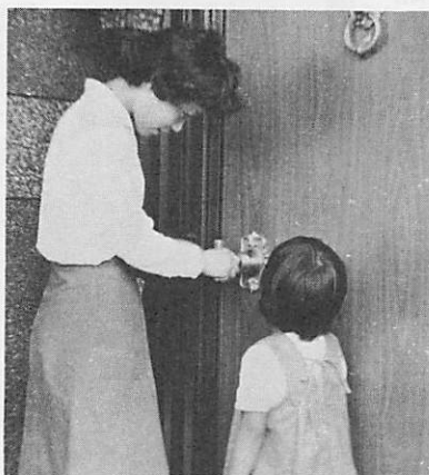
おでかけのときは、カギかけと、隣り近所に声をかけておきましょう。

十月二十七日から十一月二日まで、警察や防犯協会などの主催で、全国一せいに防犯運動が展開されます。 みんなで、次のことを励行しましょう。 ・ねる前や、お出かけのときは戸締りをきちんとし、堅固な錠でわが家をつちり守りましょう。 ・自転車は、住所と名前を記入