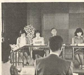
女子大生と交流の話し合い