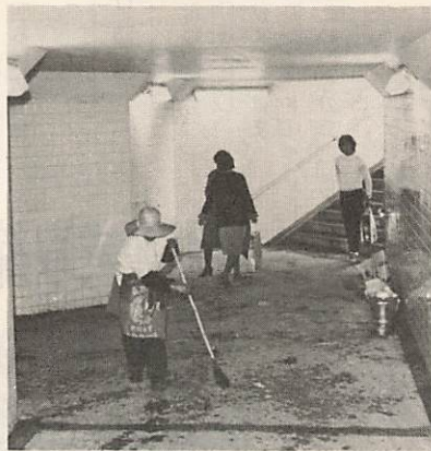
汚れがひどい市民会館前の横断地下道市では毎日掃除をしています