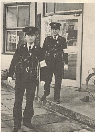
特別警らにでる警察官

どでは、財布やハンドバックはしっかりと身につけて持つことです。また、現金や貴重品の入ったカバンなどを自動車、自転車に積んだまま、その場を離れることは、最も危険です。金融機関を利用し、多額の現