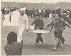
明るい笑顔の福祉体育大会

不況を脱しえなかった今年、経済は混迷を続けた年でした。また、交通事故死や火災発生など例年になく多く、暗いニュースの続いた年でもありました。 そんな中にも、人と人との結びつき、近隣社会の重要なことなどがさかんに論議され、模索がくり返され話題を生んだ年でもありました。そのため、地域社会にとつて明るい展望が開けた年といえるかもしれませぬ。市政を中心に、一年の足跡をふり返ると――