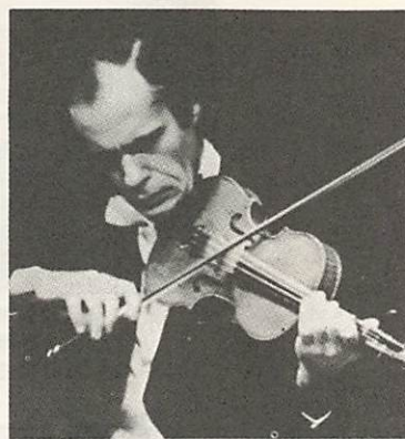
名演奏が期待されるコーガン。その演奏は、磨きあげた完璧な手練といわれる。

ソ連が誇るヴァイオリンの巨匠 レオニード・コーガン 演奏会 レオニード・コーガンのヴァイオリン演奏会が、市教育委員会・やまぐち市民文化の会の主催で次のとおり開かれます。 とき 二月一日午後六時開場 六時三十分開演 ところ 山口市民会館 プログラム シューベルト ソナタ第四番イ長調作品一六二、パッハ 無伴奏ソナタ第六 三番イ短調、プロコフィエフソナタ第一番へ短調作品八〇 ラヴェル ラブソディ・ツイガース 入場料 二千五百円、当日三千円(全席自由) 前売券発売所 十字堂楽器店 三好屋楽器店、OK無線音響センター、山口市民会館