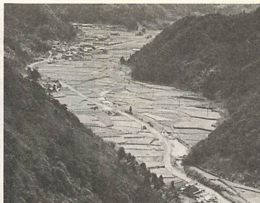
基盤整備事業が行われる仁保上郷大島・揚山・金坪地区。4年後には、耕作条件のよい農地に生まれかわります。