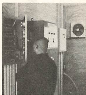
洞春寺の火災報知機

昭和二十四年一月二十六日、世界最古の木造建築であった奈良の法隆寺の金堂が失火で焼失しました。これを反省し、毎年この日を「文化財防火デー」として、文化財を火災から守るよう注意を促す日となりました。 山口市は、国宝、重要文化財などの古建築の多いまちです。それぞれの建物には火災報知設備や貯水槽(別表)などが、設備されていますが、失ったらかえらない祖先からの貴重な遺産を守るため、市民が互いに