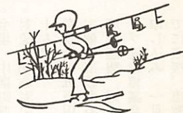
市営バス スキーの旅 一大山

日程 二月三日午後十時 市民会館前出発 四日大山 〇一五日午後十時山口帰着 料金 一万六千五百円 申し込みは、一月二十八日まで、山口市交通局 山口 〇二五五五へ。