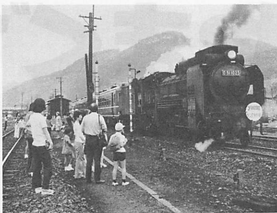
(48年9月山口線SLの記念列車)

蒸気機関車を動くようにして 保存し、国鉄山口線で、運行し ます。 て欲しいという運動がおきてい