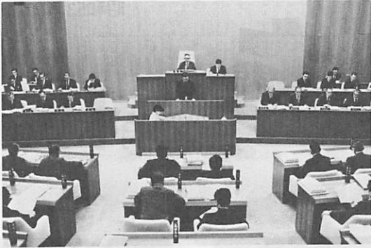
初日の市議会議場