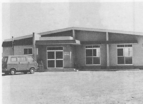
新築された長浜公会堂。広い敷地には、近くバレーボールコートがつくれることになっています。