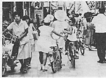
歩行者で混雑する道場門前(アーケード街)

アーケード街では 自転車は 押してください 大市から道場門前までのアーケード内は午前十一時から午後六時までは、歩行者専用道路です。 歩行者専用道路は、車両の乗入れは禁止になっています。ここは市内で最も歩行者が多いので、交通事故防止と危険防止のため、規制されたものです。 自転車もここでは乗らないで、押して歩いてください。