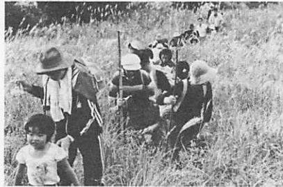
昨年の縦走ハイキング