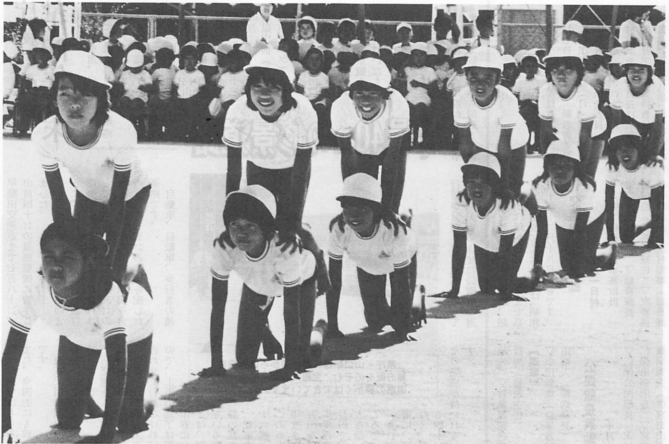
平川小学校運動会の組体操