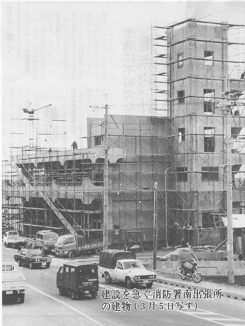
建設を急ぐ消防署南出張所の建物(3月5日写す)