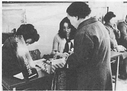
市役所市民課窓口前に設けられた「市民交通災害加入受付特設窓口」