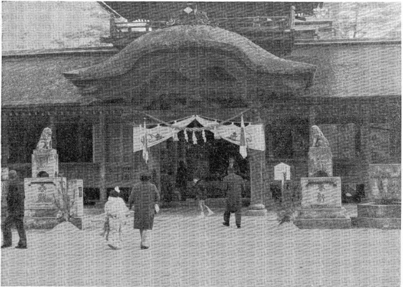
写真は 県指定重要文化財 正八幡宮初詣の人達