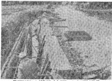
【写真は道路拡張工事現場】

(ト)不遇児 二九、五〇八円 合計二二八、一〇八円也 (伊)衣料贈呈 九四点 町道日地中線 現在改良中 前年に引続き、本年も拡張工事を行なっています。今年行なっています道路の改良延長は、一六〇米、今までの道路巾一、八米がこのたびの改良で、五米巾と、これまで車の通行も困難であった区域が、対向車の来た場合でも相当の余裕をもって、通ることができるようになります。