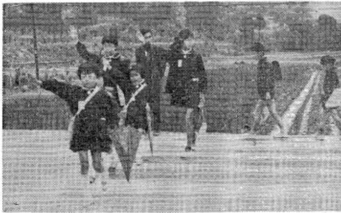
(横断舗道を仲よく渡る良い子たち)