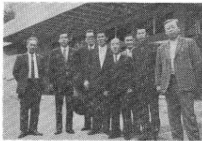
(写真は参加者のみなさん)