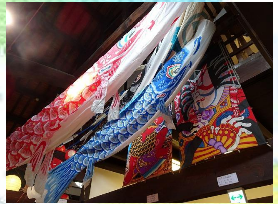
風薫る爽やかな季節を迎え伝承センターのあちらこちらでこのぼりが泳いでいます