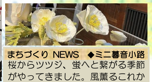
まなび館マンスリー企画展示 “書と紙人” ワークショップ開催