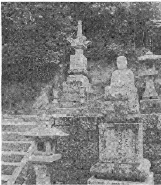
写真は禪光院境内にある大奉経塔と子育て地蔵