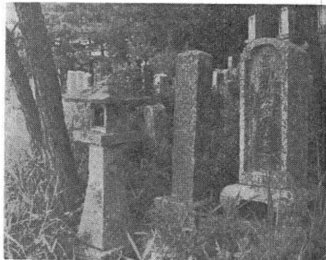
写真は幕末の志士吉岡新太郎と山邑おまさの墓

同氏祖父林太郎とその先代休兵衛の頃秋穂の大庄屋をつとめ、その時代多くの事件に関係している。文久三年(一八六三)四月藩主毛利敬親は萩から山口に居を移し攘夷実行の準備にとりかかった。そのため山口に外敵侵入するを阻止すべく小郡口と三田尻口の防備を特に厳重にしなければならぬ。そのため小郡の柳井田口に関門を設けることになった。