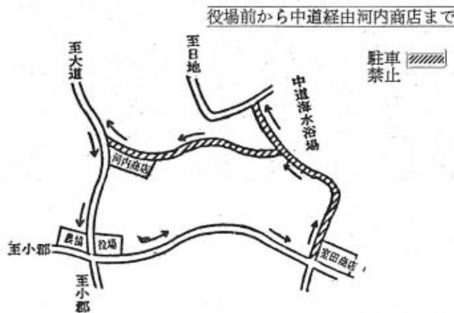
日曜日の一方通行図

一方通行期間と区間—7月12日から～8月10日までの日曜日午前9時から午後6時まで