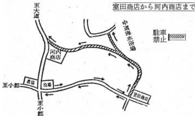
土曜日の一方通行図

一方通行期間と区間—7月12日から8月10日までの土曜日・午後1時から午後6時まで