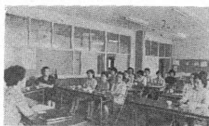
熱心に学習する「消費者学級」のみなさん

飛脚をとばして小郡勤場に連絡した。息せき切って走りつづけた飛脚は代官所につくや卒倒気絶する有様であったという。 このことがあって間もなく花香や長浜に隠し砲台を据えつけた。花香の位置は今のプールの西墓場近くであって、やがて菅倉山西麓に移すことになる。その小地名、お台場・番小屋の名が残っていたとは藤田章一氏の話。 長浜の砲を天田福楽寺に取りあげ隠しておくことになり、二〇〇〇余人の人力が村人の中から動員された。奇兵隊や八幡隊が秋穂に駐屯するようになったのもこうしたことがあってからのことである(以下次号) (秋穂町教育委員会囑託 田中 稷記)