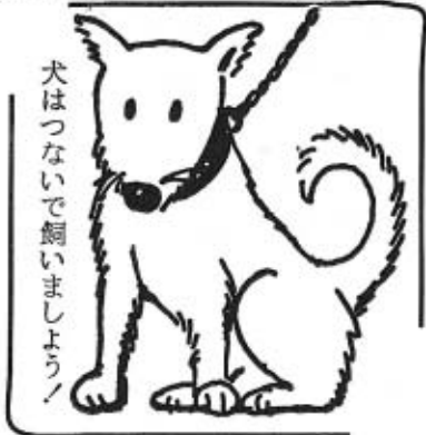
犬はつないで飼いましよう