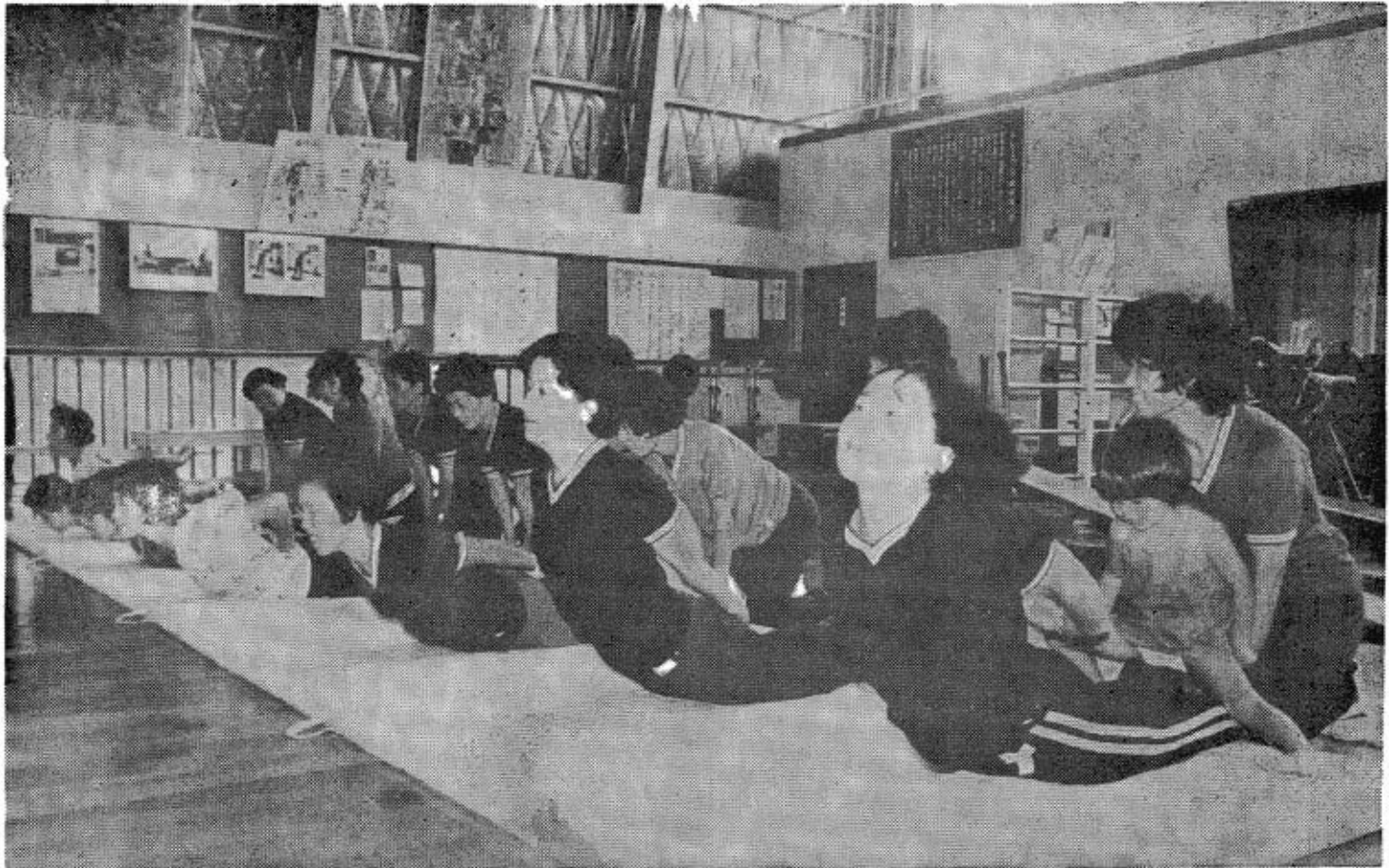
(とじこんで保存しましょう)