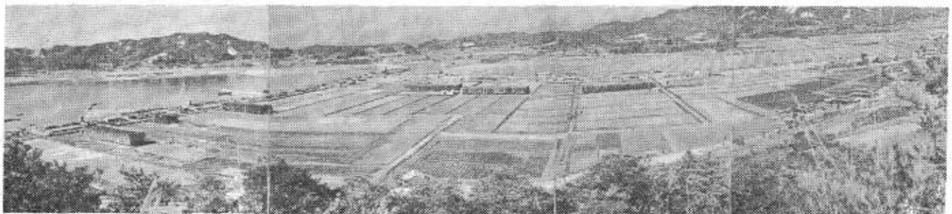
写真は旧青江塩田全景