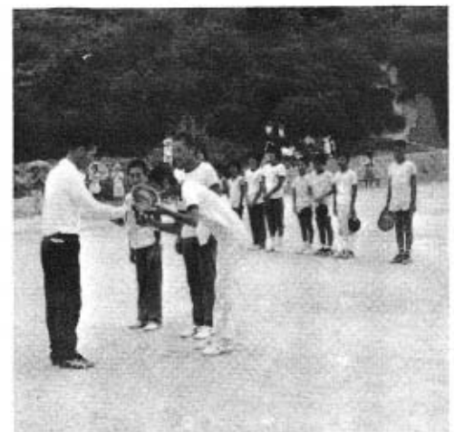
三尾子ども会会長から、優勝カップを受ける西天田子ども会