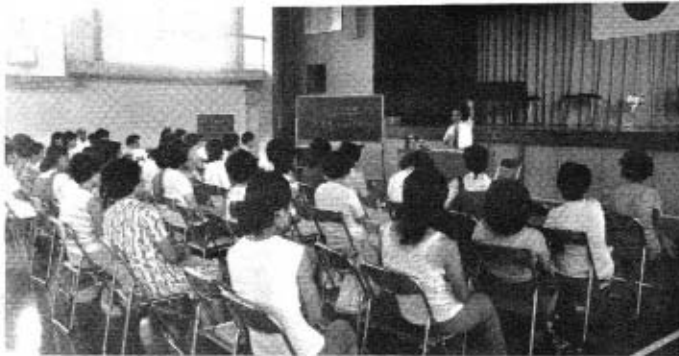
写真 熱心に学習する会員たち