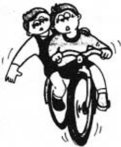
ふらつき運転の危険