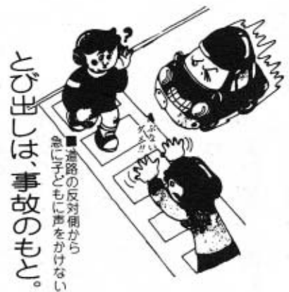
歩行者は、事故のもつ。 道路の反対側から急に子どもに声をかけない。