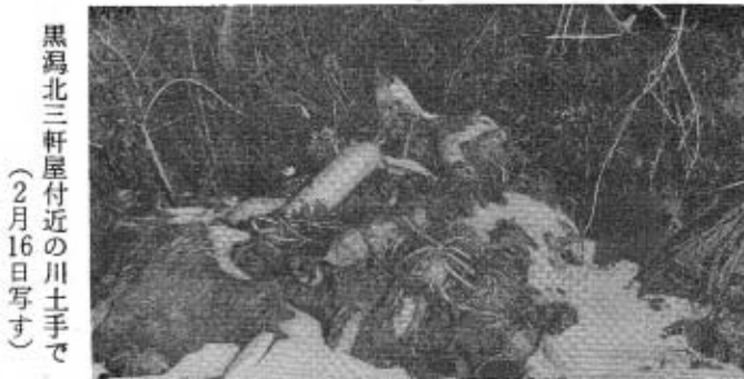
黒潟北三軒屋付近の川土手で (2月16日写す)