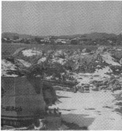
捨てられたゴミやガレキが山積みの、浜内塩田埋立地 (2月17日写す)