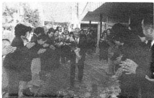
「ご苦労さま」と、職員のおねぎらいの言葉と拍手に送られて、役場を去る末貞前町長（17日）

その他 共済見舞金額・請求の方法等については、「加入申し込み書」をご覧のうえご不明なことは、総務課へお尋ねください。