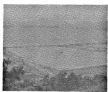
41年当時の花香塩田跡一帯

彼は銀主とも言っており、荒浜のまま売りさばき、彼の手元に残った石崎浜は難渋薄地の所で、開立整地に特別多くの資金を要した。そして他の浜主と対立して孤立、