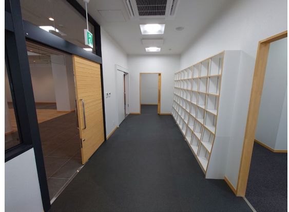
待合・図書コーナー