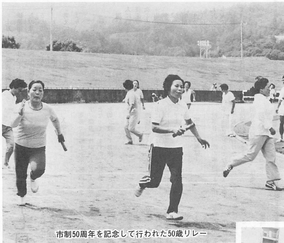
市制50周年を記念して行われた50歳リレー