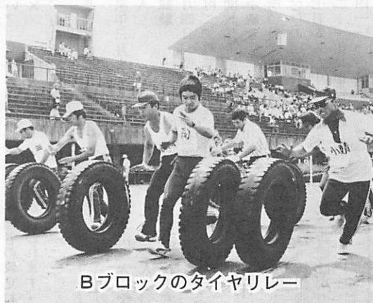
Bブロックのタイヤリレー

九月二日県陸上競技場などで開かれた第十六回市民体育大会は、人口規模によって市内十六地区をA・Bブロックに分け、陸上競技、ソフトボール、バレーボール、卓球の地区対抗戦が行われました。