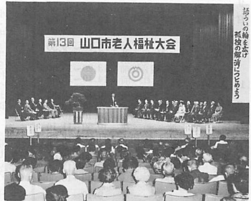
若いの輪を停 孤球の解凍にためま