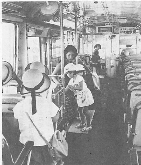
今日も走る市営バスの車内。市民の利用をおおいに期待します。

と、一般会計からの補助が一億六千三百四十余万円と大幅であったことによるもので、決して、経営が好転したものではありません。