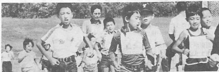
昨年の体力テストで