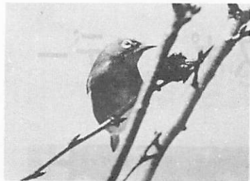
紅葉して目白のうたも寂びにけり 一梯二郎一

夏の面影がすっかり消え、ひっそりと秋の深まりゆく月。8日寒露、23日霜降、そぞろ寒冷をおぼえる項です。27日から読書週間、秋の夜長を静かに読書にふけるのも、この月のならわしです。