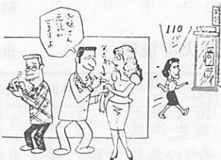
“甘い誘い”にのると必ず後悔します

犯罪にはしる—— 覚せい剤を常用すると、不眠、頭痛、食欲減退などで、気力、体力がおとろえ、ついには「だれかに追いかける」「切りつけられる」などの幻覚、妄想におそわれ、殺人、傷害などの犯罪をおかす、また、購入費用捻出のため、