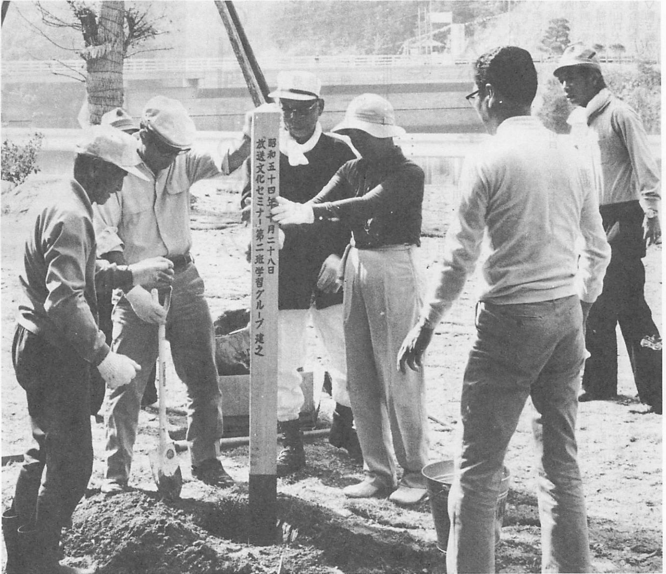
昭和五十四年十月二十八日 放送文化セミナー第二班学習グループ建之