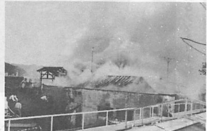
いったんでた火事は、速度をまして、勢いが強くなります。