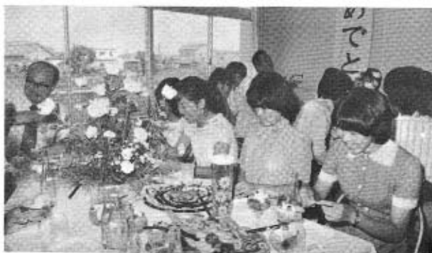
テーブルごとの楽しい語らい

出席した新成人の感想は テーブルを回って「夏の成人式をどう思いますか」と尋ねると「気軽に出席でき、夏がよかったと思う」とか「学校があるので、冬はとても帰れない。夏でよかった」という声が男女とも多かった中で、ある男性は「やはり気分が出ない」とも。 また、行事内容については「今日で十分と思う」「よかった」と、話していました。