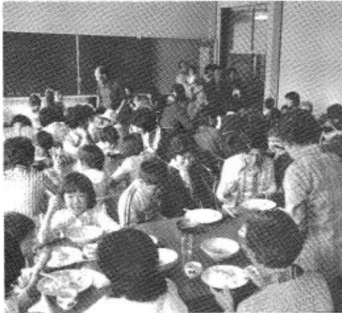
押すな、押すなの大盛況のバザー会場。おいしきもばつぐんでした。↑