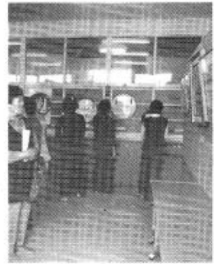
これが、学級生の作品かと、おどろくような作品ばかりでした。絵画書道の発表会場。