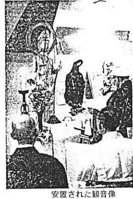
安置された観音像

納骨塔に観音像 合同納骨の三層にある郷土資料室に このほど観音像が納められました。高き約 一・九尺の真ちゆ観で、ほほ寄大です このため町議会議列席のもと開眼式を 行ないました。今後いろいろな観音像 を仏像として納めようとする。