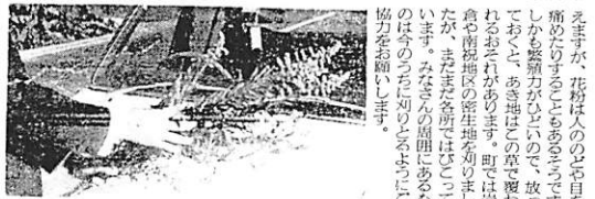
残念、適中者なし 町の人口減り懸念

「アサガハ」の草花は、黄色の花を咲かせ、葉は緑色で、非常に美しい。この草花は、阿知須町の各地でよく見られる。また、町内には、草花の栽培を楽しむ人々も増加している。これは、町民の生活の豊かさを示している。また、草花の栽培は、町民の心を和ませ、生活の楽しみを増やしている。