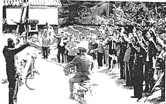
第一便を喜ぶ青畑地区の人々

「ワァーイ、郵便がきた!」 青畑30年ぶりに配達再開 「ワァーイ、手紙がきた!」青畑地区の人々、青畑郵便局の入口で郵便物が配達されるのを喜ぶ様子。郵便局員がイキイキと郵便物を配る姿が、人々の心を和ませている。青畑地区は、昭和十五年六月五日、人手が足りないため、郵便物の配達を中止した。その後、郵便物の配達を再開し、人々の生活に大きな変化をもたらした。