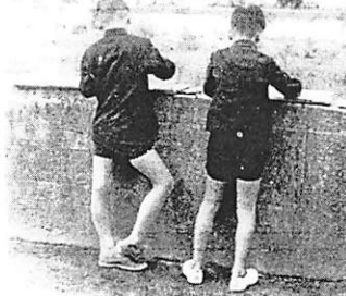
秋は詩人を生み、豆画伯を育む。写真は、阿知須町公民館で開かれた秋の作品展の様子。