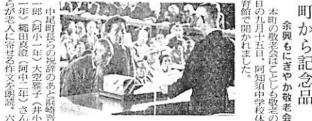
老夫婦三組に町から記念品

一人が月三千元、二人が月二千五百円、三人以上が月二千円、児童手当は児童の健康成長を促すため、町が負担することになります。これは、町が負担することになります。