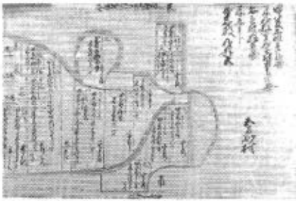
写真一 宝暦検地帳絵図

「地下上申」の秋穂村石高境目書には、秋穂二島御蔵入諸給領共総高七二八石三三二で内二島分が三三四八石三五二とあり、両村を一括しながら内訳を示している。 宝暦検地と秋穂 宝暦一年(一七六一)から同一三年にかけて藩主・重就が行ったもので、精緻な小村帳、絵図の大部分が秋穂町役場文書に残っている。