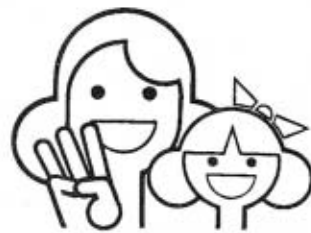
愛のひと声運動シンボルマーク