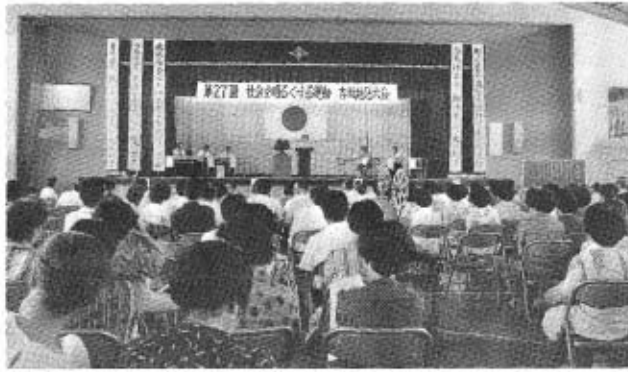
去年の第27回社明大会