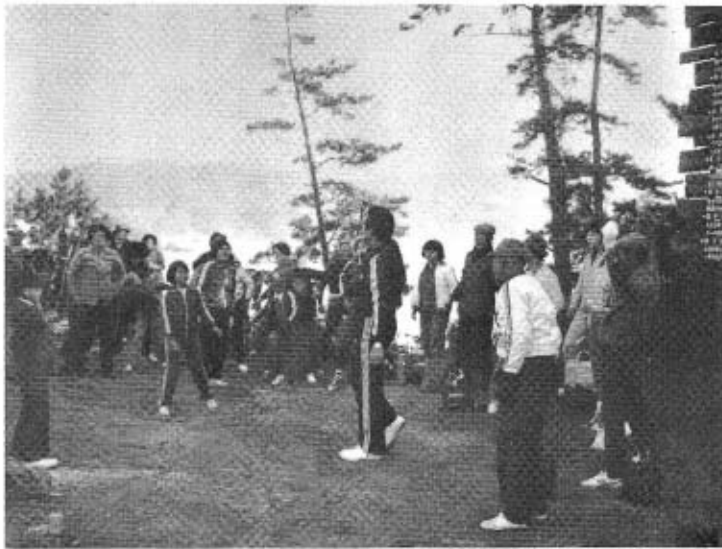
歩く前にまず準備体操

絶好のスポーツ日和に恵まれた十二月三日(日)、総勢百五十九人の参加を得て、県民スポーツ総参加運動(歩こう運動)の一環として、笠戸島の瀬戸遊歩道三・五