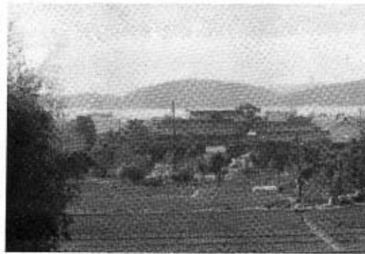
中屋・藤田家の全景

をつとめ、六代目・源右衛門は前号でも述べたように、幕末軍艦献納銀を差し出して嫡孫代まで名字を許された。