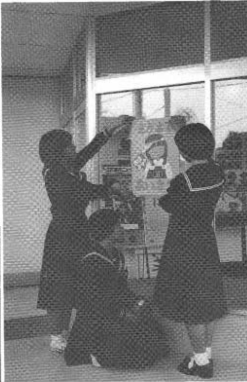
自分たちのつくったポスターをは る、秋中・美術クラブの皆さん