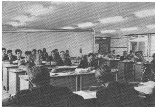
3月23日の定例町議会

昭和五十四年度の一般会計予算をはじめ、国民健康保険特別会計予算、国民宿舎特別会計予算および交通災害共済事業特別会計予算が、三月十二日招集の定例町議会に提出されました。