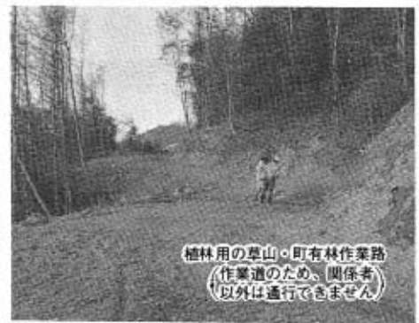
植林用の登山、町有林作業路 作業道のため、関係者 以外は通行できません

総務費におきましては、長年使用しております軽自動車が老朽化してまいりましたので、この購入費として八十万円、複写機の購入費として七十万円、見やすい戸籍を編製するため「戸籍専用タイプライター」購入費として三十万