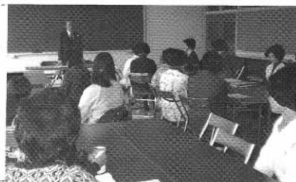
3月15日今年度 最後の家庭教育学級

最後に、今の私たちは、終戦後 の母の時代に比べ、このような講 演を聞くことができるのを、大変 幸せに思っています。