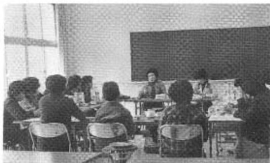
公民館での学習活動

幼稚園 幼稚園につきましては、幼児の健全な発育を促進するため、器具の整備を図っております。