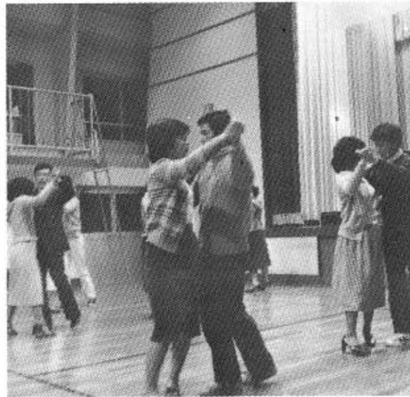
53年度に、初めて開設された*ダンス教室。ダンスの基本をみっちり教わり、みなさん、シルバからワルツまでマスターしました。

四月。自然も春を迎えて、一斉に活動を始めました。自分にも、何かを始めたいと考えておられる皆さん、新年度から、公民館での楽しい学習活動に参加してみませんか。最近、社会教育、特に生涯教育の重要性が、強くいわれるようになりました。こうした時、公民館は住民の皆さんの意向をとらえながら、社会や経済の変動に対応できる学習活動をすすめていかなければならないと思います。 そこで五十四年度も、引き続き学習活動の場としての学級や教室を開設します。 募集要項については、チラシでお知らせしますので、多数ご参加ください。